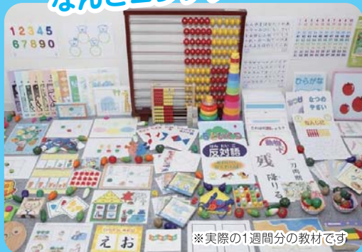
※実際の1週間分の教材です

コペルのレッスンでは、こどもたちの瞳をいつも輝かせ、好奇心と集中力を引き出すために、驚くほど多彩なオリジナル教材を次々と使用していきます。