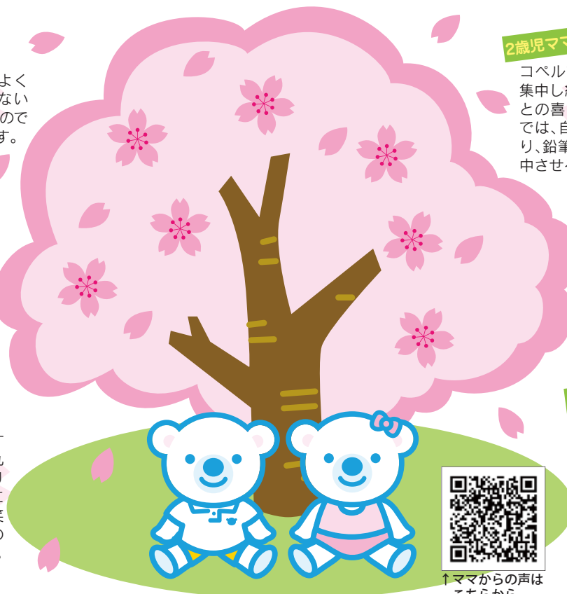
↑ママからの声はこちらから

次々と変わるレッスンの内容を食べい入るように見ている様子から、子どもの興味、関心、好奇心、学びたい意欲などを目の当たりにした気がしました。こういった環境は家庭では提供しがたいので、何より子どもが楽しいというので通うことに決めました。