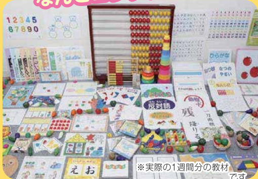
※実際の1週間分の教材です

コペルのレッスンでは、子どもたちの瞳をいつも輝かせ、好奇心と集中力を引き出すために、驚くほど多彩なオリジナル教材を次々と使用していきます。